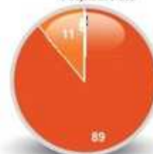
4/ Sujets abordés