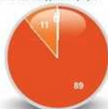
7/ Méthode et supports employés