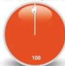
3/ Conformité aux objectifs annoncés