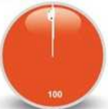
10/ Intervention HITMAN