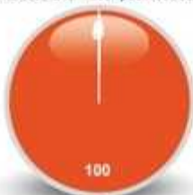
2/ Intérêt de la formation pour votre travail