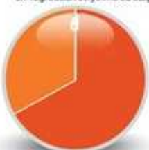
6/ Progression et rythme du stage