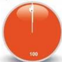
9/ Exposés et apports de l'animateur