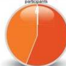
8/ Qualité et intensité des échanges entre les participants